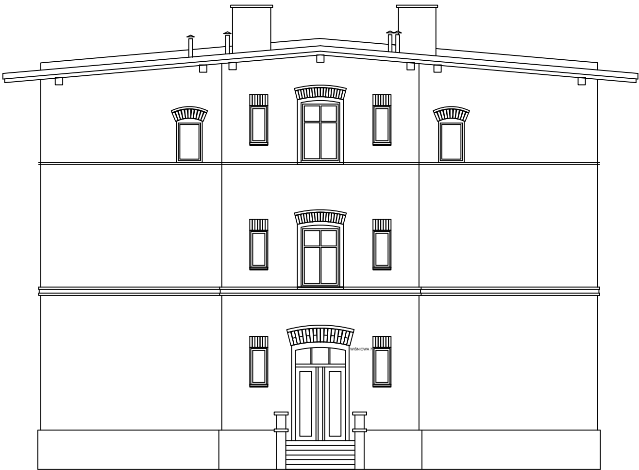
ELEWACJA PÓŁNOCNA ul. WIŚNIOWA 5-7

mgr inż. arch. AGNIESZKA BOKIEWICZ-MARCHEWKA Szczegółowy rysunek architektoniczny do projektu budowlanego ul. m. 27/30/OK/7017, Członek Izby Inżynierów Architektów Polskiej Rzeczypospolitej Agneszka Boki