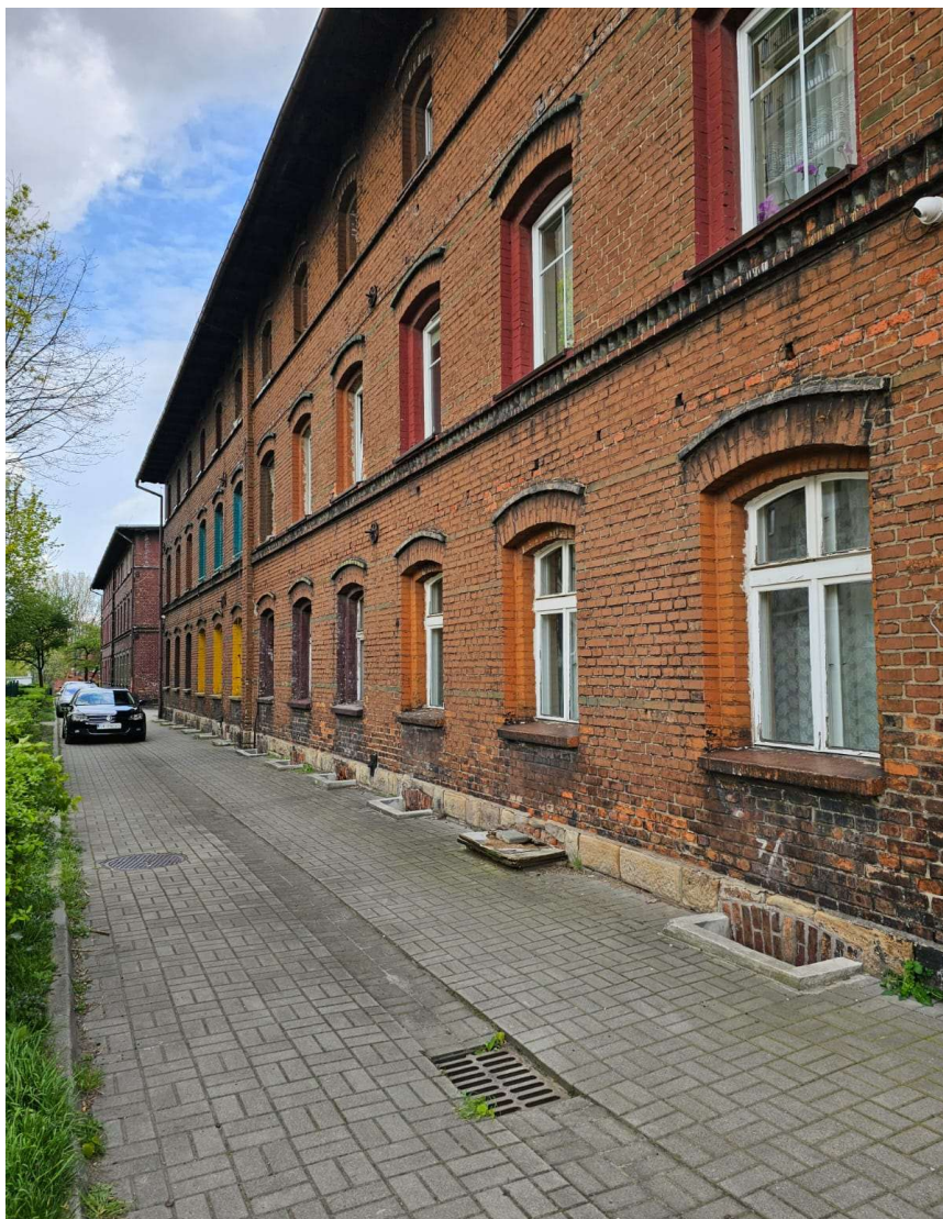
Fot. 1, 2, 3. Elewacje budynku mieszkalnego przy ul. Wiśniowej 5,7.